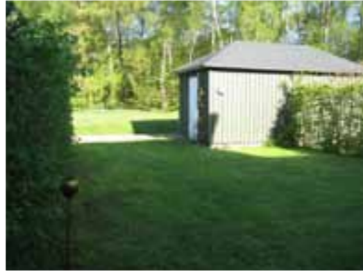
FÖRE En gräsplätt, två häckar och ett förråd. Så var det då. I dag är trädgården ombonad och trivsam med flera funktioner trots den lilla ytan.