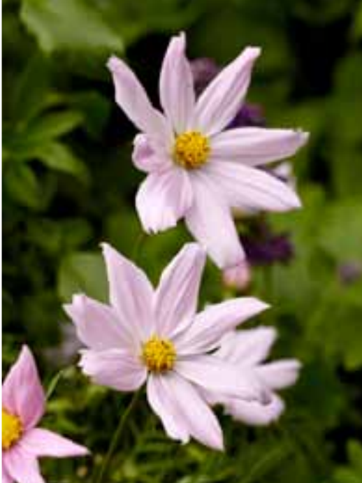
Några ettåriga plantor får fylla ut i perennrabatterna här och där. Söta rosenskärnan, Cosmos bipinnatus , passar fint.