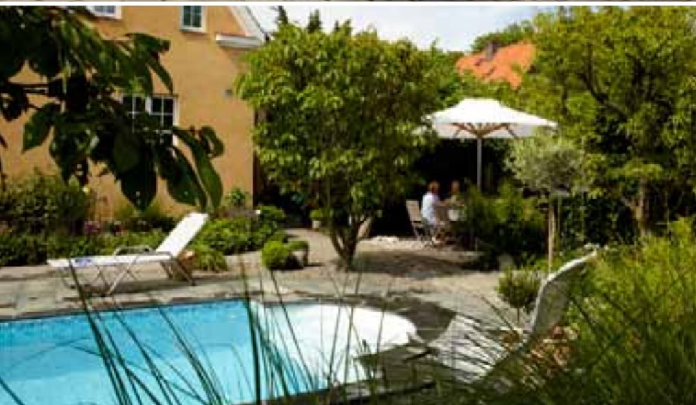
Det är svårt att tro att poolen och trädgården bara har några år på nacken, men så har också de gamla träden sparats.

Ljuden i trädgården är sådana som hör den bästa av sommardagar till. Fågellarna kvittrar, bin och humlor brummar runt och kaffeservisen på brickan som bärs ut till bersån skramlar så där hemtrevligt. Och alldeles intill hörs badplums och barnskratt.