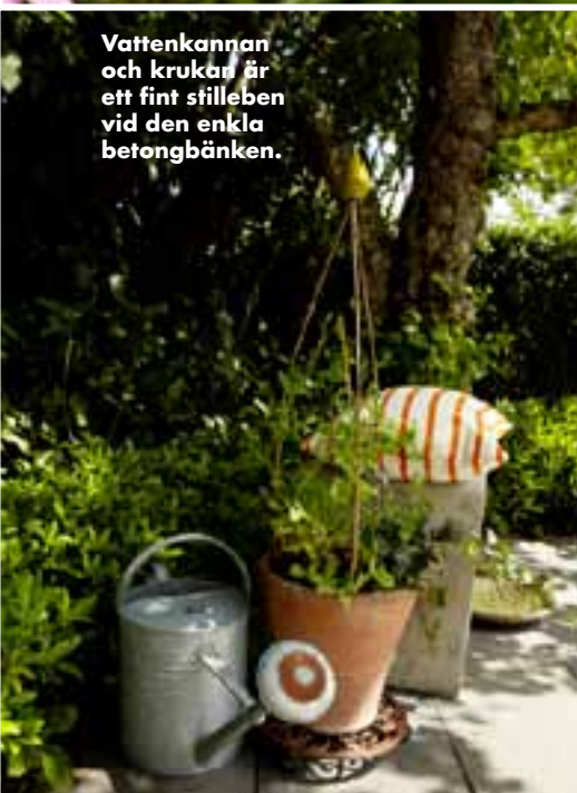
Vattenkannen och krukorna är ett fint stilleben vid den enkla betongbänken.