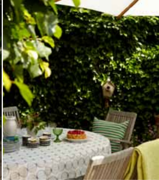
Här äts de flesta måltider när vädret tillåter. Sittplatsen är mjukt inbäddad i grönska men man ser ändå stora delar av trädgården därifrån.

gräs och sjösten, få trädgården lite ”bullig” med buxbomsklot och små uppstammade träd – och knyta samman detta med de älskade gamla perennerna och frukträden. För de befintliga knotiga träden och en vacker vild perennrabatt var viktiga att bevara.