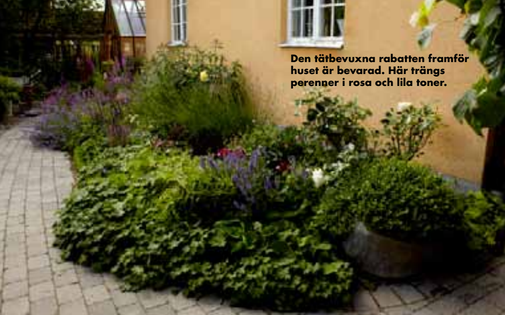
Den tätbevuxna rabatten framför huset är bevarad. Här trängs perenner i rosa och lila toner.