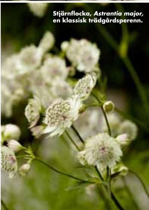
Stjärnflocka, Astrantia major , en klassisk trädgårdspenn.