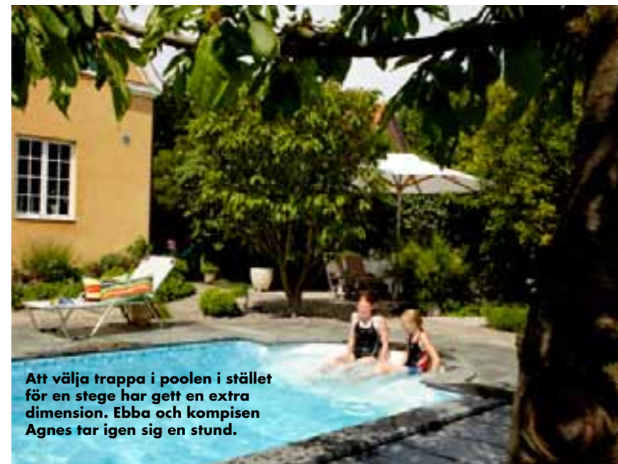
Att välja trappa i poolen i stället för en stege har gett en extra dimension. Ebba och kompisen Agnes tar igen sig en stund.