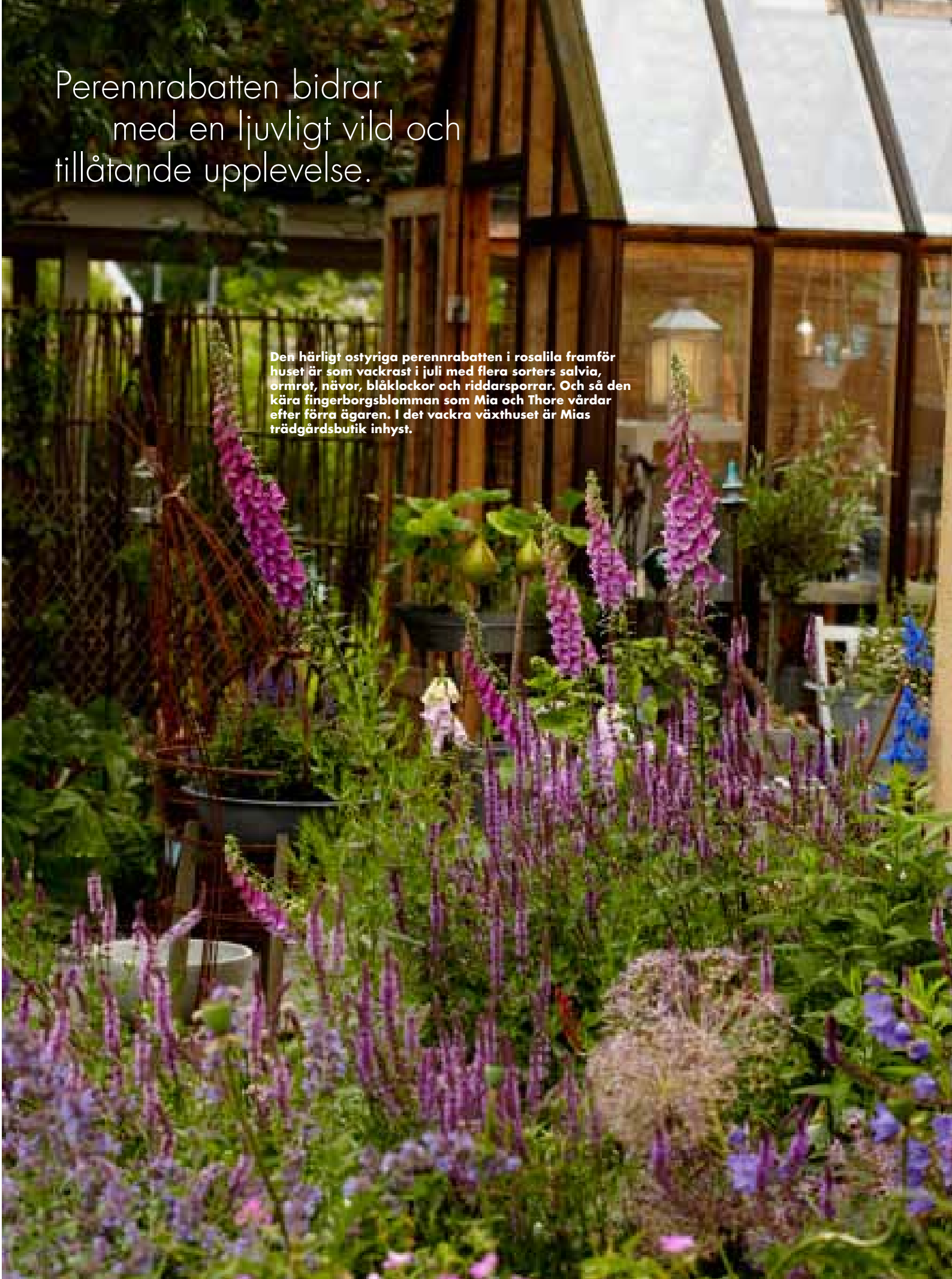
Den härligt ostyriga perennrabatten i rosalila framför huset är som vackrast i juli med flera sorters salvia, örmmrot, nävor, blåklockor och riddarsporrar. Och så den kära fingerborgsblomman som Mia och Thore vårdar efter förra ägaren. I det vackra växthuset är Mias trädgårdsbutik inhyst.

Perennrabatten bidrar med en ljuvligt vild och tillåtande upplevelse.